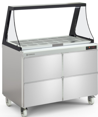
SDTP-48-18-LGL con cajonera opcional with optional drawer set